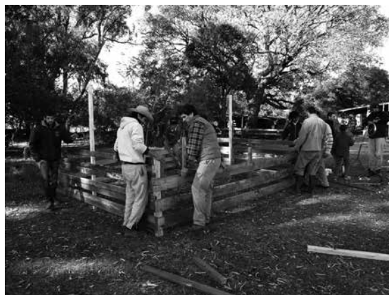
Figura 1. Taller de Armado de Corral Cama Profunda (mayo 2015), Magdalena, Provincia de Buenos Aires

Las tareas habían sido divididas previamente: los productores se habían encargado de comprar los materiales (decisión estratégica, dado que este aspecto los obligó a que fueran los actores locales quienes hicieran el desarrollo de proveedores de los materiales, aspecto positivo a la hora de reparar un componente, etcétera). En el momento de la presentación de los materiales en el lugar, previo a la construcción, se observó que los listones de madera no tenían el largo que previamente se había proyectado. A su vez, este detalle modificaba las medidas generales del corral y, por lo tanto, las del techo. Este aspecto, que en principio se presentó como un problema, obligó a todos los presentes a repensar cómo readecuar las medidas. Esas instancias de discusión, donde se puso en juego