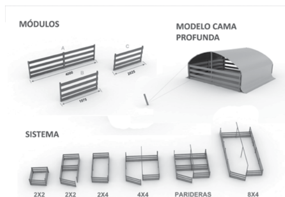
Figura 2. Sistema de diseño ciclo completo. Alternativas bajo una misma tecnología

A partir del relato, entendemos que el diseño industrial en países como la Argentina, entre otros enfoques posibles, debe generar alternativas para el desarrollo social que sustenten un nuevo modelo de desarrollo tecnológico e industrial, diferente al modelo capitalista de progreso que ha dado como resultado esquemas de industrialización centralizados y a gran escala. Estas teorías tecnológico-sociales pueden encontrarse bajo el nombre de Tecnologías Alternativas (TA) (Dickson, 1978), vernaculares o de periferia (Bonsiepe, 1985) o intermedias (Schumacher, 1973).